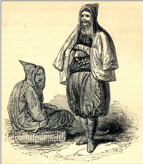
Κάτοικοι της κρητικής υπαίθρου. Σχέδια του Βρετανού περιηγητή R. Pashley, 1834

Η πρώτη μεγάλη νίκη των επαναστατών σημειώθηκε στις 14 Ιουνίου 1821 στο Λούλο Χανίων, όπου εξοντώθηκε ένα σώμα γενιτσάρων από τα Χανιά. Οι Τούρκοι απάντησαν με σφαγές αμάχων, λεηλασίες σπιτιών, μαγαζιών και εκκλησιών στα Χανιά. Οι σφαγές επεκτάθηκαν στο Ρέθυμνο και στις 23-24 Ιουνίου στο Μεγάλο Κάστρο (Ηράκλειο), όπου οι νεκροί έφτασαν τους 700, ανάμεσά τους ο Αρχιεπίσκοπος Κρήτης Γεράσιμος και οι επίσκοποι Κνωσσού, Χερρονήσου, Λάμπης και Σφακιών, Σητείας και Διοπόλεως. Στη Σητεία οι νεκροί ήταν 300. Στο δεύτερο δεκαπενθήμερο του Ιουνίου οι Κρητικοί νίκησαν στο Ζουριδί (Μάχη των Ρουσιτικών) αλλά και στις Καλύβες και στο Βοθειακό. Μεταξύ των επικεφαλής των ήταν και ο Μιχ. Κουρμούλης που ανήκε στη γνωστή οικογένεια των Κουρμούληδων, που ήταν Τουρκοκρητικοί αλλά, συγκλονισμένοι από τις σφαγές των Ελλήνων, φάνερωσαν ότι ήταν κρυπτοχριστιανοί και τάχθηκαν με το μέρος των επαναστατών.