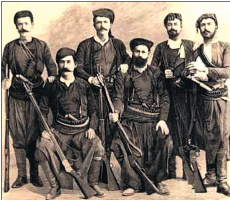
Μικρή ομάδα αρχηγών του επαναστατικού κινήματος

Σφακιών, ως απάντηση στις Τουρκικές αγριότητες, η "Καγκελλαρία", μία τοπική κυβέρνηση, και κηρύχθηκε επίσημα η Επανάσταση. Η διαταγή των Πασάδων της Κρήτης για καθολικό αφοπλισμό των Χριστιανών δεν έγινε δεκτή από τους επαναστάτες, που κατασκεύασαν φυσέκια ("χαρτούτσια") από τα βιβλία εκκλησιών και μοναστηριών και βόλια από τα βαρίδια των ζυγαριών, για να λύσουν το πρόβλημα των πολεμοφοδίων.