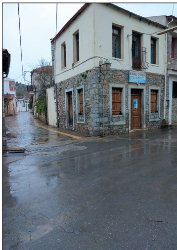
Έρημη Φουρνή, τα καφενεία κλειστά

Και αυτούς τους τρεις μήνες, η Φουρνή, όπως και όλη η ανθρωπότητα, συνεχίζει να βρίσκεται στον κλοιό της πανδημίας του κορωνοϊού. Όπως αναφέραμε και στο προηγούμενο σημείωμά μας η Φουρνή φαντάζει έρημος τόπος, με τις μετακινήσεις να έχουν περιοριστεί στο ελάχιστο και τις δραστηριότητες να επικεντρώνονται στις πλέον απαραίτητες. Με τα μαγαζιά κλειστά και τους δρόμους έρημους κάθε επίσκεψη στη Φουρνή σου προκαλεί μελαγχολία και στεναχώρια.