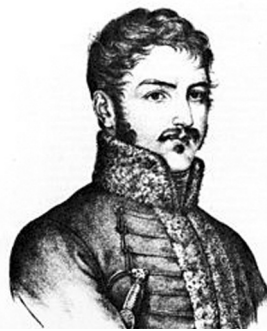
Ο Ιωσήφ Βαλέστ ή Βαλέστρας (Joseph Balestra, - 1822) ήταν Γάλλος φιλέλληνας αξιωματικός, κορσικανικής καταγωγής, που γεννήθηκε στην Κρήτη.

Αυτή τη χρονική στιγμή, με την Επανάσταση σε εξάρση και τους Τούρκους αποκλεισμένους στα κάστρα, έφθασε στην Κρήτη ως εκπρόσωπος της Κεντρικής Διοίκησης της Ελλάδας, ο Πέτρος Σκυλίτσης Ομηρίδης, προκειμένου να συγκροτήσει τοπική συνέλευση. Η συνέλευση πραγματοποιήθηκε στους Αρμένους Αποκορώνου και από τις εργασίες της προέκυψε το «Προσωρινόν Πολίτευμα της νήσου Κρήτης» (21 Μαΐου 1822), κείμενο σημαντικό για την πολιτική και οικονομική οργάνωση του νησιού. Επίσης, στους Αρμένους σταθεροποιήθηκε η θέση του Αφεντούλιεφ ως γενικού αρχηγού της Επανάστασης με τον τίτλο του «Γενικού Επάρχου της Νήσου», πράγμα απαραίτητο για την επικράτηση πνεύματος ομόνοιας στις πολεμικές επιχειρήσεις.